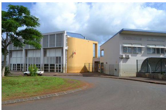
Collège de TSINGONI

Pour les élèves en difficulté à Mayotte, la SEGPA est une chance. Elle leur permet de suivre un enseignement de qualité, de se sensibiliser à un métier, de raccrocher avec les apprentissages.