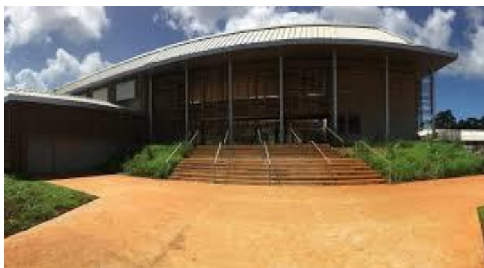
Collège de OUANGANI