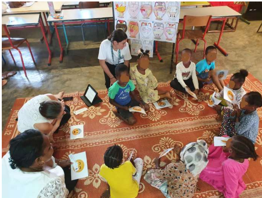
Les étudiantes puéricultrices auprès des élèves de CP 4

Si tu penses être victime de violences sexuelles ou si tu connais un ami qui pourrait en être victime, tu peux en parler à ton enseignant, à la directrice, à tes parents ou appeler le 119.