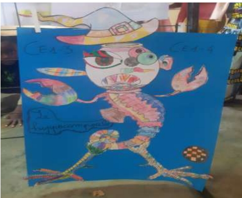
L'hippocampoule (CE1 4 et 5)

Encore une fois, toutes les classes ont participé au musée , avec des résultats très variés. Les élèves de CM1 1 ont observé de nombreuses méthodes utilisées par les élèves de l'école : du coloriage, du collage, du dessin, de la peinture , l'utilisation de feuilles, de cartons, ils ont même observé des sculptures !