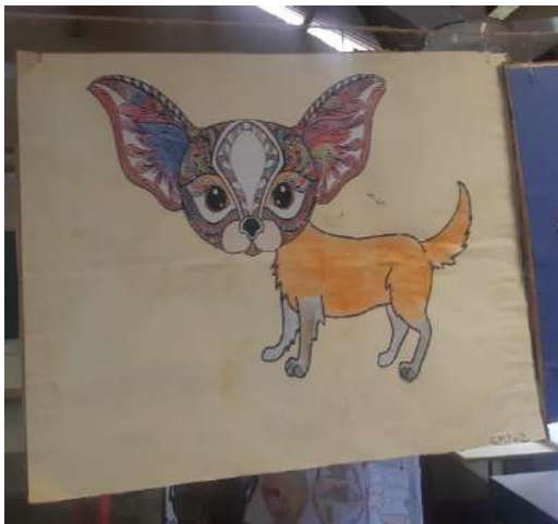
Chimère construite par découpages et collage (CM2 2)