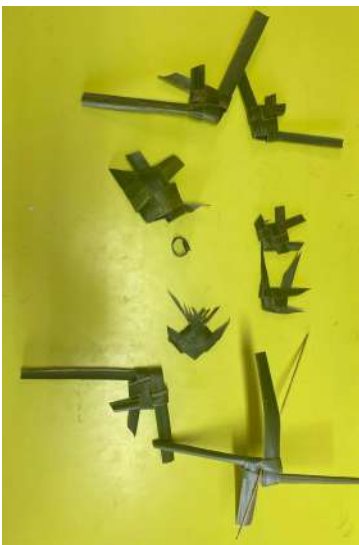
Des jouets traditionnels tressés en feuille de coco (classes de CE1 3 et 4)