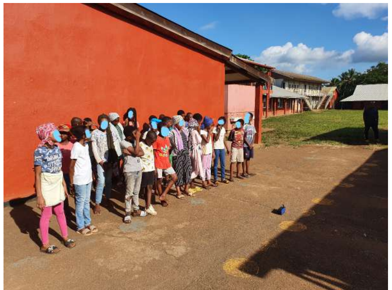
Sketch en shicombani et chant traditionnel (CM2)